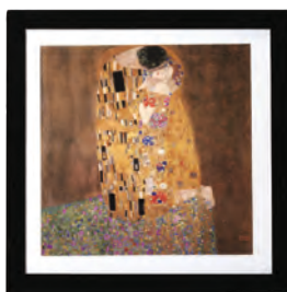
MA09R / MA12R