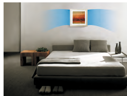
Ночной режим (подача воздуха в сторону)