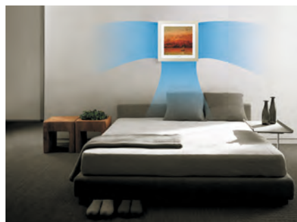
Стандартный режим работы (подача воздуха в трех направлениях)

В зависимости от выбранного режима воздушный поток может быть изменен для более комфортного кондиционирования.