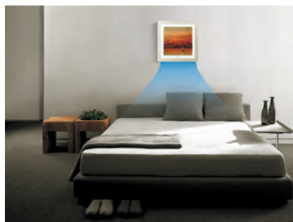
Форсированное охлаждение (подача воздуха вниз)