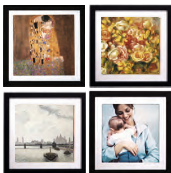
Как заменить изображение

Сменные изображения передней панели и нестандартный корпус квадратной формы делают внутренние блоки серии Gallery заметной деталью любого интерьера. Настенные блоки серии ARTCOOL отличаются современным дизайном и отделкой и станут эффектным дополнением помещения.